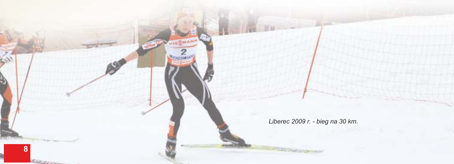
Liberec 2009 r. - bieg na 30 km.