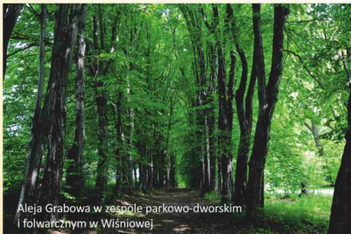
Aleja Grabowa w zespole parkowo-dworskim i folwarcznym w Wiśniowej

G minę Wiśniowa tworzy 13 wsi położonych w dolinie Wisłoka oraz wzdłuż jego północnych i południowych dopływów. Zachodnią granicę gminy stanowi naturalny fragment Pogórzy: Strzyżowskiego i Dynowskiego, ujęty granicami parku krajobrazowego. Na południe od doliny Wisłoka jest to zalesione pasmo Jazowej z Czar-