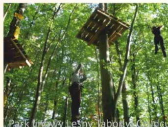
Park im. Leśny Zaborów Czudec

położonym rynkiem, w pobliżu którego znaleźć można liczne jeszcze drewniane domy mieszczkańskie z przełomu XIX i XX w. oraz synagogę żydowską, w której obecnie mieści się biblioteka gminna. Cennym zabytkiem jest kościół parafialny p.w. Świętej Trójcy, wzniesiony w stylu barokowym w latach 1713-34 i otoczony w 1752 r. murkiem z dwiema