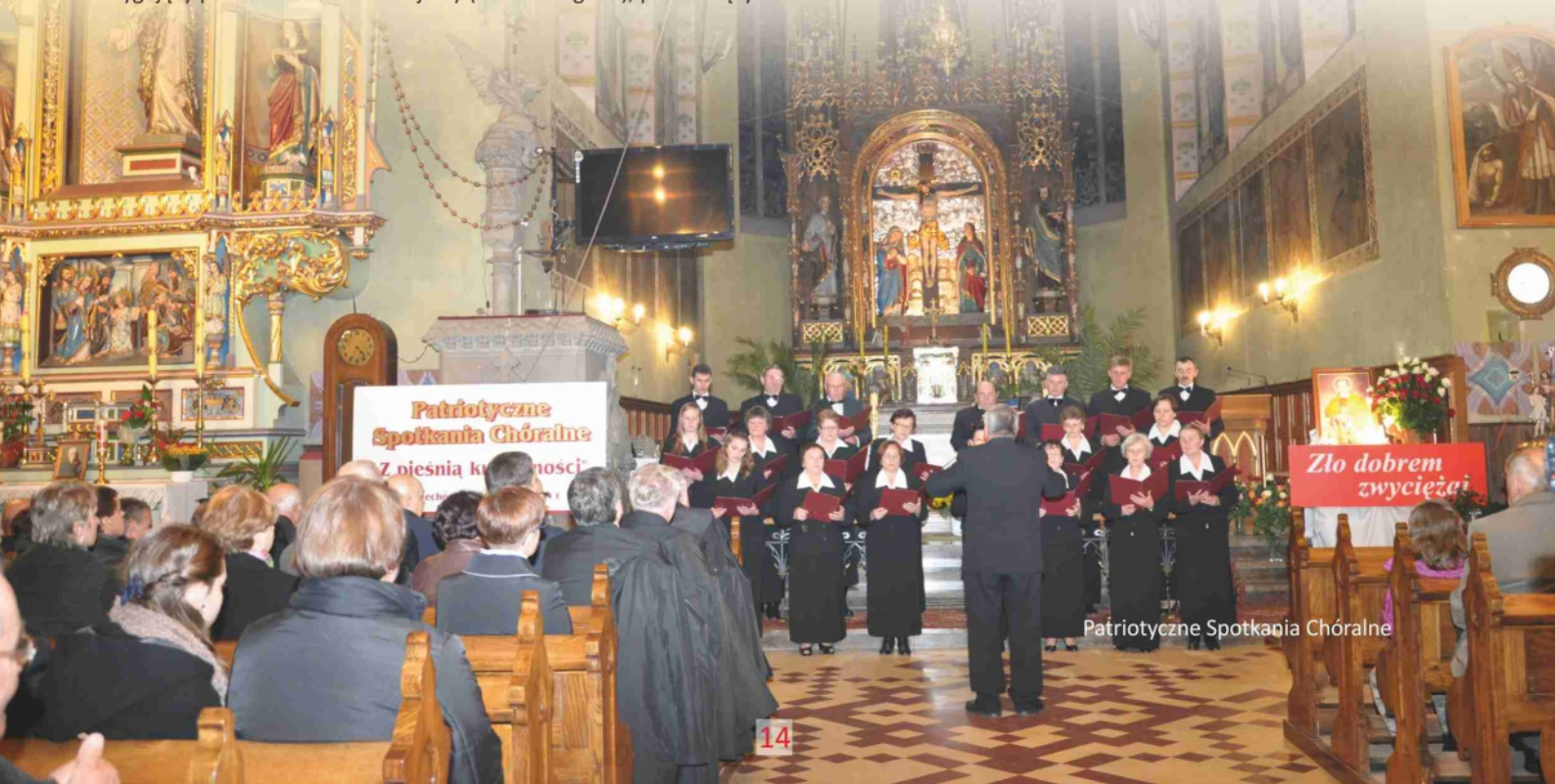
Patriotyczne Spotkania Chóralne