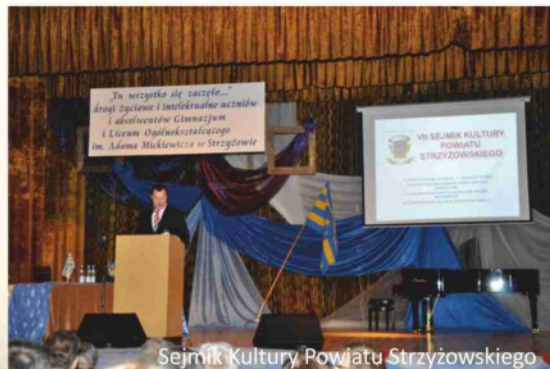
Sejnik Kultury Powiatu Strzyżowskiego

pod Żarnowską Górą do dworca kolejowego w Strzyżowie, a także ciekawy architektonicznie, neogotycki kościół parafialny w Dobrzechowie. W mieście i gminie Strzyżów, podobnie jak w całym powiecie odbywa się rokrocznie wiele imprez kulturalnych, turystycznych i sportowych.