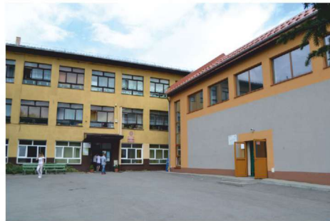
Zespół Szkolno-Przedszkolny w Trzebini