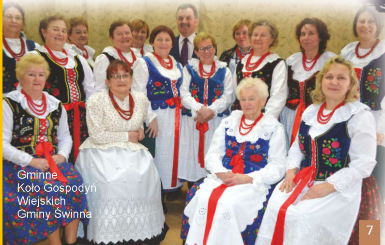
Gminne Koło Gospodyń Wiejskich Gminy Świnna

The mosaic of diversity and attractions we find in the Świnna commune is complemented by cyclical cultural, sports and recreational events. There is a great interest in outdoor events; Holiday night with ghosts "(Świnna)," Hay festival "(Pewel Ślemieńska)," Świniański kogel mogel "(Świnna), Parafiada (Trzebinia), Parish Family Festivals (Pewel Ślemieńska, Przyłęków)," Pewel Forever Festiwal "(Pewel Mała) ) and the Mini Marathon "For the Cup of the Mayor of the Świnna Commune". The still living tradition and folklore are manifested in organizing the so-called "Easter Table" which is a culinary contest on which the Country Housewives' Club present their unique, traditional Christmas dishes.