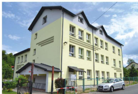
Zespół Szkolno-Przedszkolny w Pewli Śmieńskiej

34-331 Świnna, ul. Wspólna 13 tel. 33 863 80 71, 502 719 906, gok@swinna.pl www.swinna.naszgok.pl