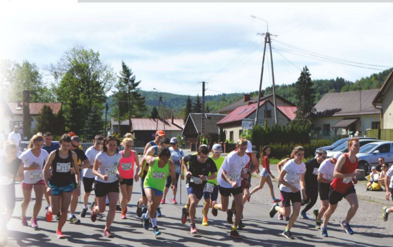
Mini Maraton o Puchar Wójta Gminy Świnna

Mosaic różnorodności i atrakcji jakie odnajdujemy w Gminie Świnna, uzupełniają cykliczne imprezy o charakterze kulturalnym, sportowym i rekreacyjnym. Duże zainteresowanie budzą imprezy plenerowe; Wakacyjna noc z duchami" (Świnna), "Święto siana" (Pewel Ślemieńska), "Świniański kogel mogel "(Świnna), Parafiada (Trzebinia), Parafialne Festyny Rodzinne (Pewel Ślemieńska, Przyłęków), "Pewel Forever Festiwal" (Pewel Mała) i Mini Maraton "O Puchar Wójta Gminy Świnna". Ciągłe żywa tradycja i folklor przejawiają się w organizowaniu tzw. "Stołu Wielkanocnego" czyli konkursu kulinarnego na którym prezentują się Koła Gospodyń Wiejskich ze swymi wyjątkowymi, tradycyjnymi potrawami świątecznymi.