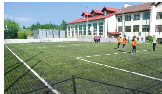
Boisko wielofunkcyjne przy ZSP Świnna