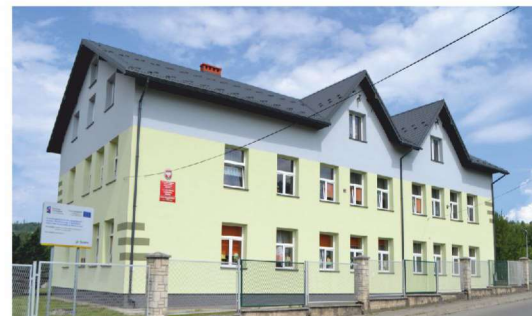
Zespół Szkolno-Przedszkolny w Pewli Małej