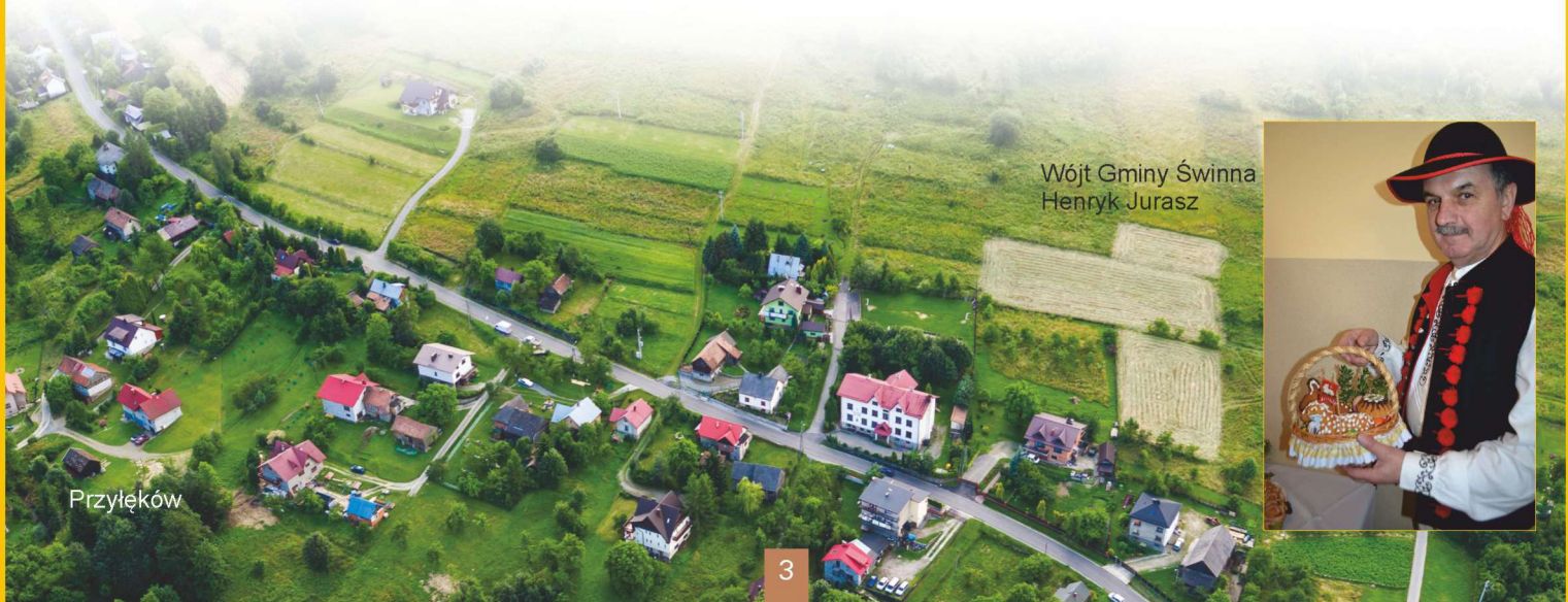
Wójt Gminy Świnna Henryk Jurasz

ying south-east of Żywiec, Świnna Municipality is a special place for all those who want to actively and creatively spend their free time. Mountain hiking enthusiasts can find many trails here; yellow leading from the center of Świnna to Moczarki nad Przyłękowem, blue running from Trzebinia to Romanka and a unique trail created by youth from the "Zwyczajni" association called "The Road of Green Scented Pine" leading from Świnna to Pewel Ślemieńska. The uniqueness of these trails lies in the fact that here you can find peace and quiet "disturbed" only by the sounds of birds and roaring streams.