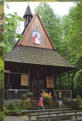
Kaplica w Kiełbasowie